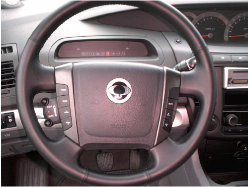
Régulateur avec commande au volant