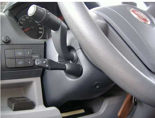
Régulateur avec commodo standard